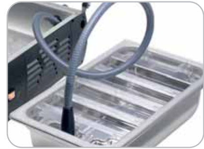
Tubo per aspirazione esterna opzionale External suction hose optional